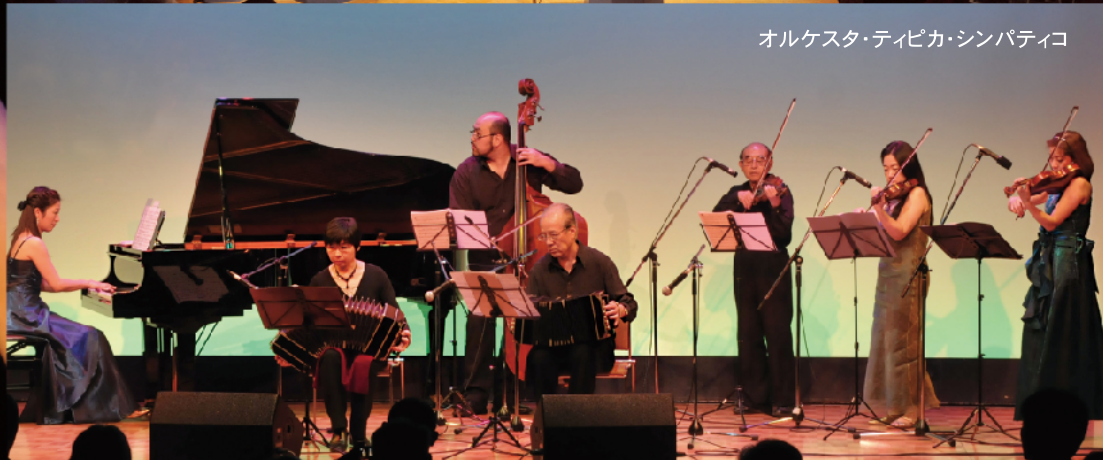
オルケスタ・ティピカ・シンパティコ